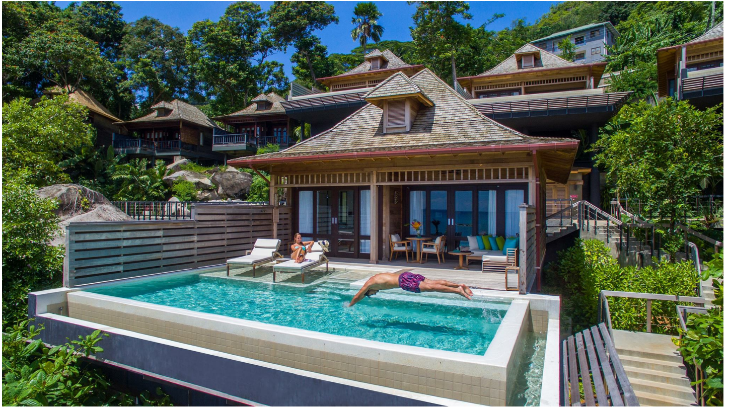
Beau Vallon Beach

Hilton Northholme beherbergt luxuriöse Villen an bester Lage - hier werden Sie auf erstklassigem Niveau verwöhnt.