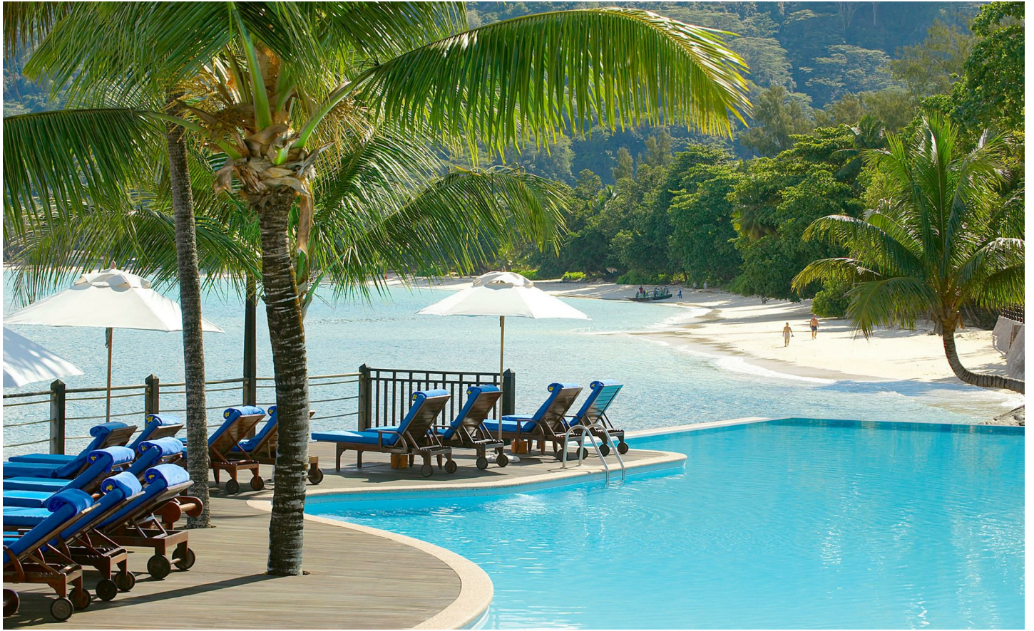
Beau Vallon Beach

Das sehr beliebte Hotel bietet ein hohes Mass an Privatsphäre, einen persönlichen Service und verspricht ein angenehmes Wohlfühl-Ambiente.