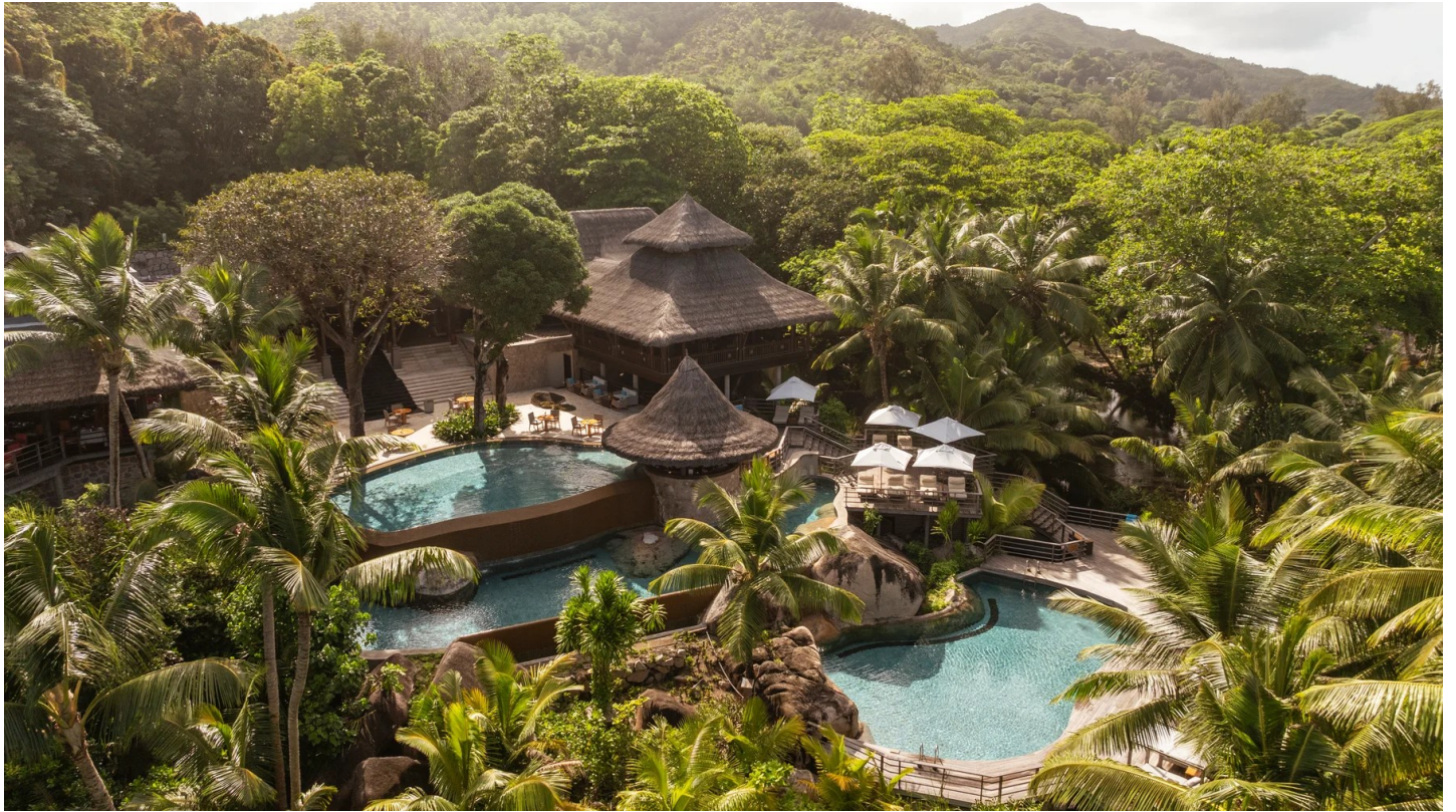
Anse Kerlan Beach

Ein hervorragender Platz für maximale Erholung. Hier genießen anspruchsvolle Gäste das exklusive Erlebnis vollkommener Privatsphäre.