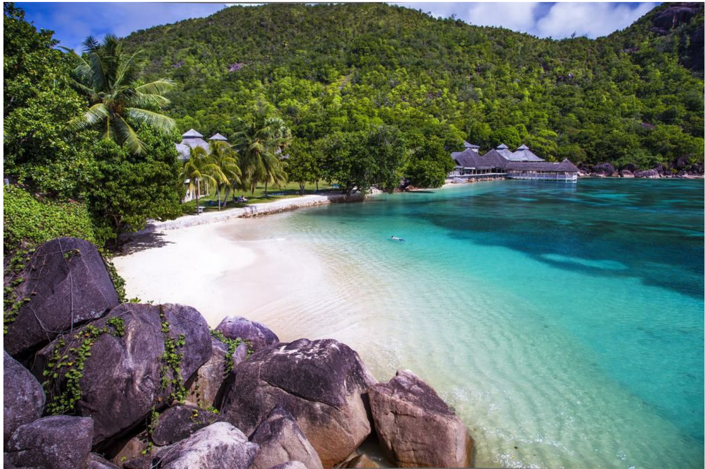
Anse Petit Cour

Herrliche Lage für unvergessliche Urlaubstage in romantischer Umgebung - ideal für sowohl für aktive, wie Ruhe suchende Gäste.