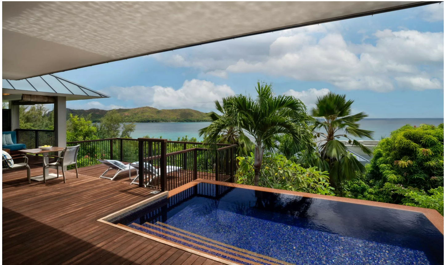
Anse Takamaka Beach

Erleben Sie im modernen Raffles Praslin unvergessliche Ferien im Paradies. Geniessen Sie die Ruhe inmitten traumhafter Naturlandschaften.