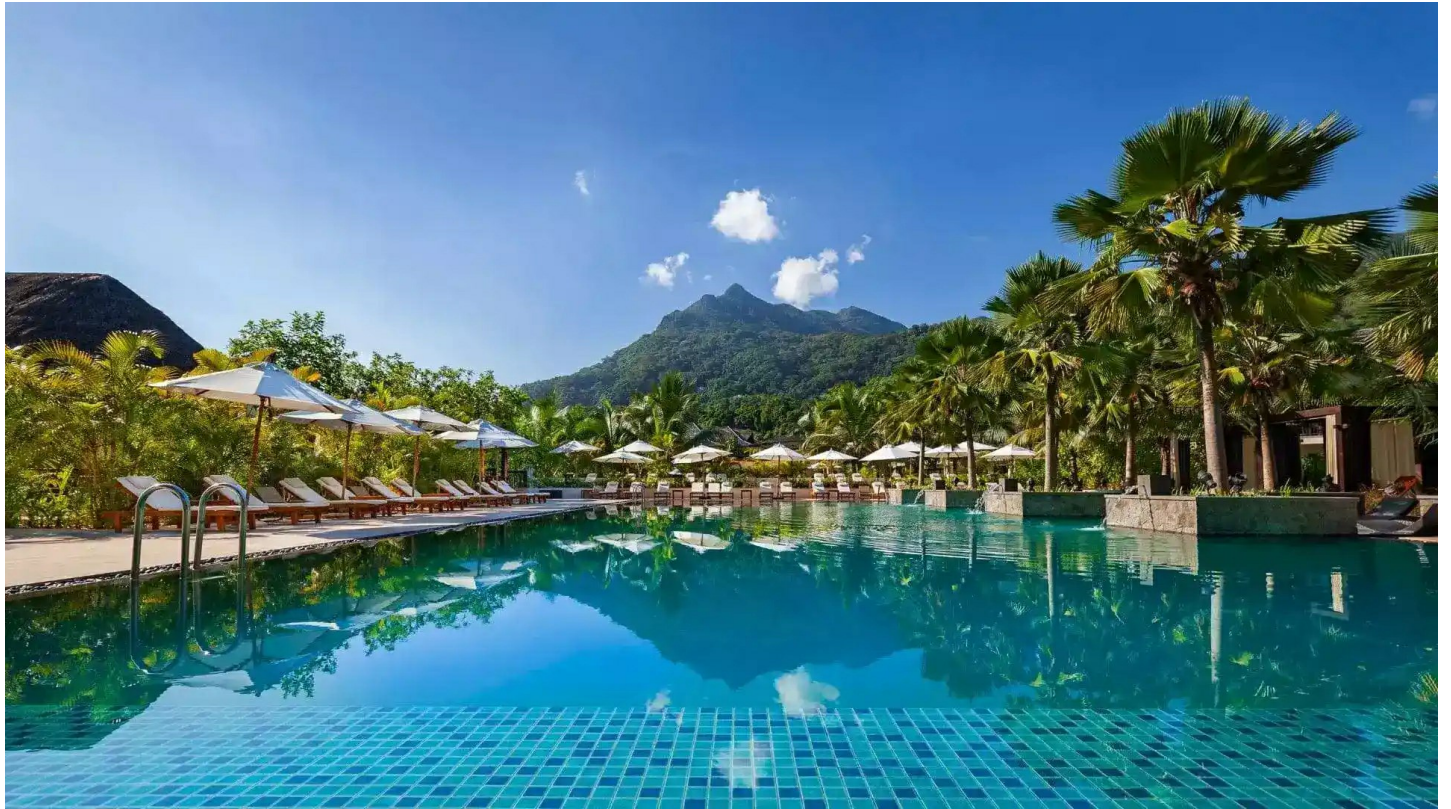
Beau Vallon Beach

Der Baustil des Boutiquehotels fügt sich harmonisch in seine tropische Umgebung ein. Es ist eine Oase der Ruhe am lebhaften Beau-Vallon-Strand.