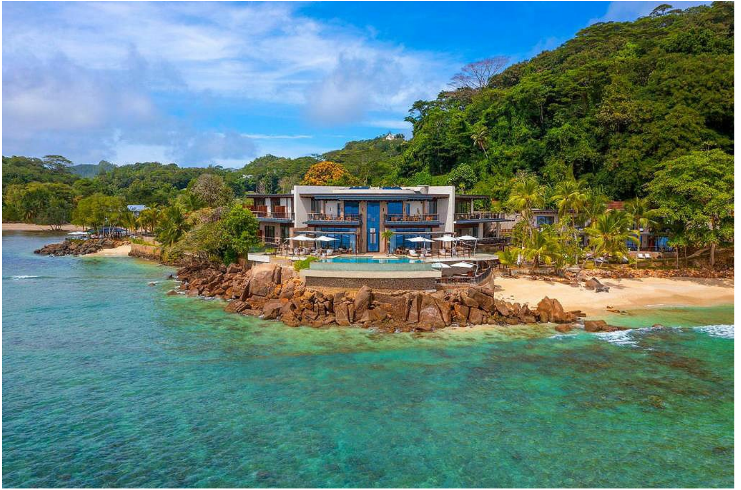
Anse aux Poules Bleues

Ein Rückzugsort und ein Ort der Inspiration - modern, intim und elegant setzt es einen neuen Massstab in der Luxushotellerie auf den Seychellen.