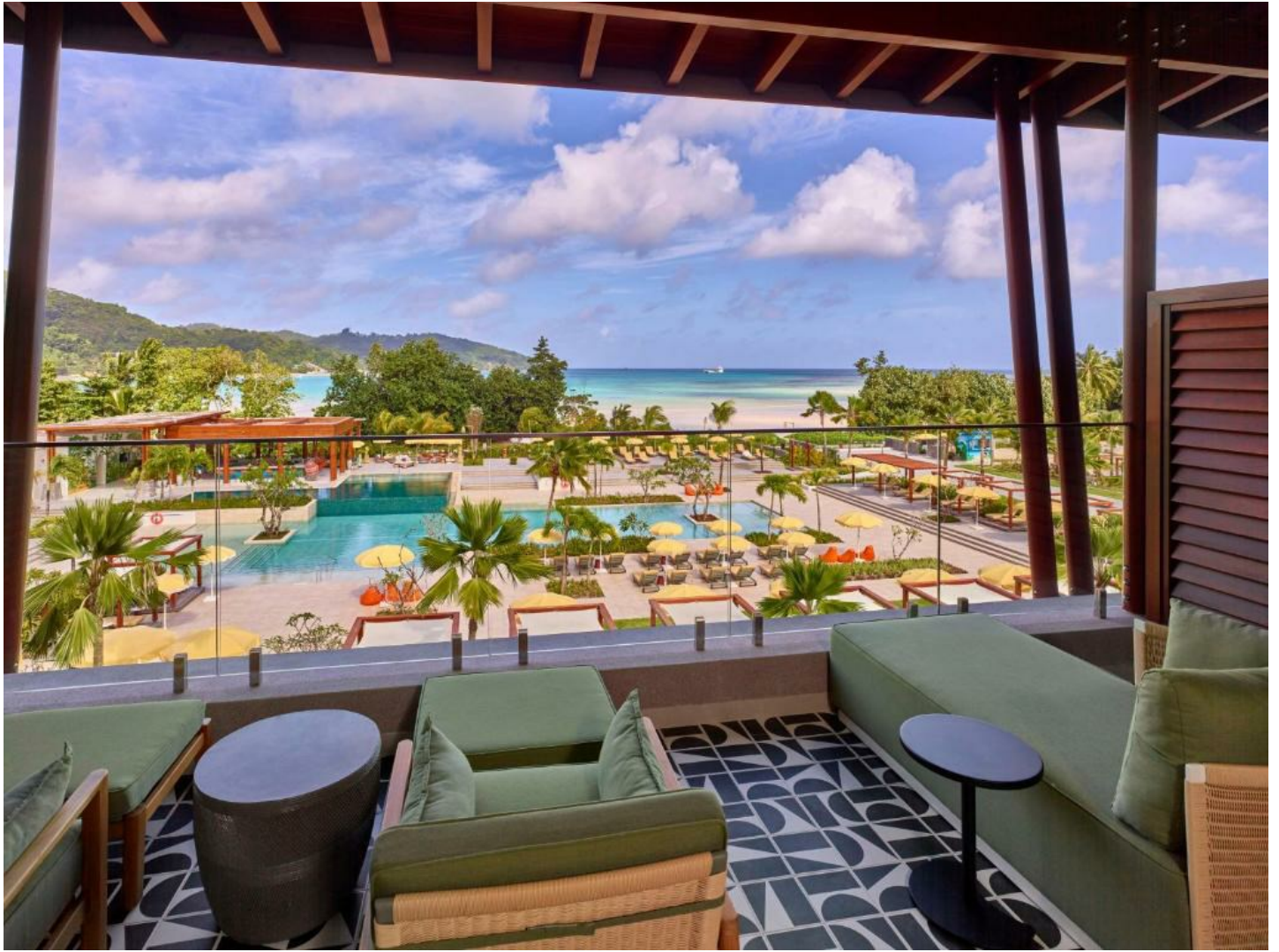
Anse La Mouche

Das neue, urbane, schicke Strandhotel auf Mahé bietet die perfekte Mischung aus Lifestyle und Authentizität.